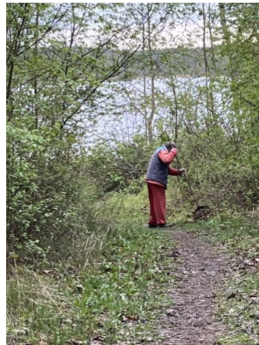
Ett gäng såg till att det blev fint vid badet på Södra, där kommunen nu har tagit ner de träd som var angripna av bävrarna.