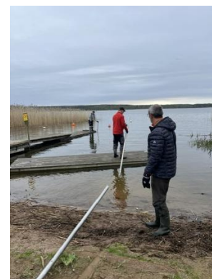
Ett annat gäng tog sig an det tunga jobbet med att få i bryggan på Norra. Starkt jobbat!