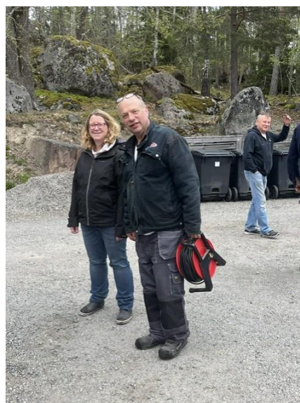
Områdesansvariga ledde och fördelade arbetet som vanligt