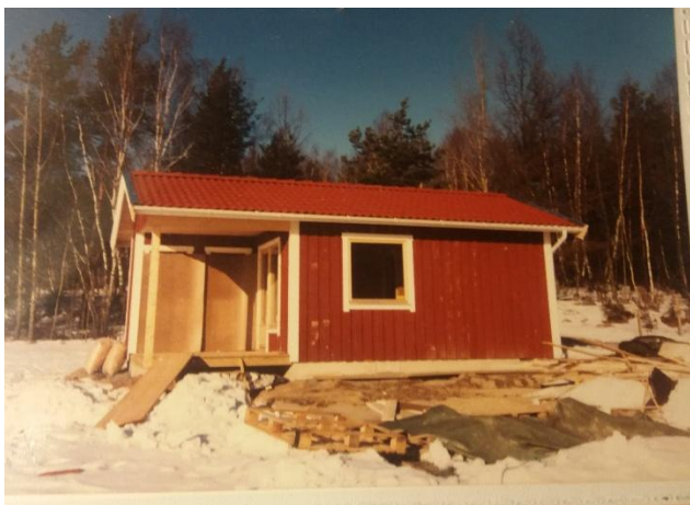
Mitt hus februari 1987

Har du själv något minne eller en bild att dela med dig av? Maila mig, ami.lexmark@hotmail.com