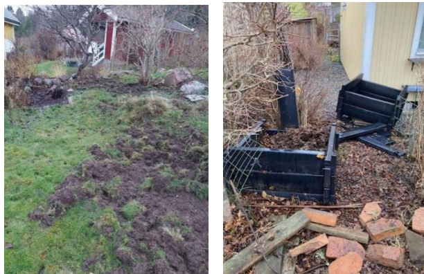
Bevis på svinens vilda framfart.

Tyvärr har några medlemmar på Södra fått rejäl påhälsning av vildsvin i sina trädgårdar. Svinen har bökat enormt mycket och förstört både rabatter, staket och annat. Vi har från styrelsen anmält detta till kommunen och bett om skydds jakt. Det ska sägas att en av anledningarna till svinens framfart är att det på vissa ställen lämnats kvar mycket fallfrukt, något som självklart lockat dem. Det är alltså ytterligare en anledning att ha sin tomt i gott skick. För att i möjligaste mån undvika dessa vilda besökare, se till att du inte har fallfrukt liggande på marken eller på annat sätt tillgängligt.