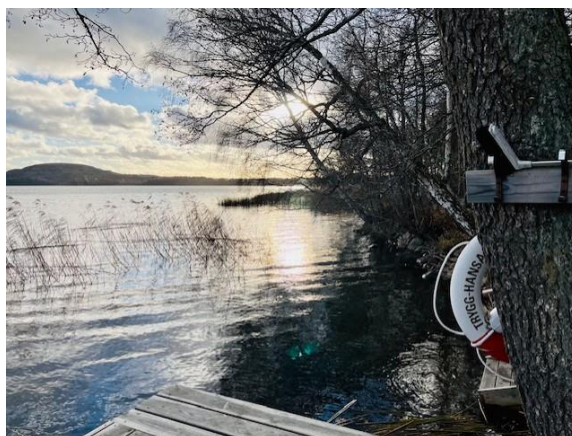
En novemberdag vid Ullnasjön (ett mer sympatiskt namn än förr)